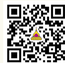
ดาวน์โหลดแบบฟอร์มการขอ ตำแหน่งทางวิชาการ (Update 19 ก.พ. 69)