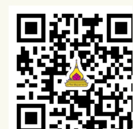
ระเบียบ ข้อบังคับ ประกาศมหาวิทยาลัยที่ เกี่ยวข้อง

หรือดาวน์โหลดเพิ่มเติมได้ที่ (งานบุคคล) https://polsci.ubu.ac.th/