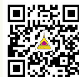
เอกสารบรรยาย 26 ม.ค. 69