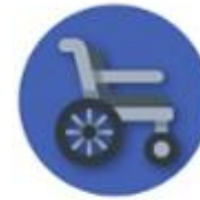
ข้อมูลสุขภาพ ความพิการ