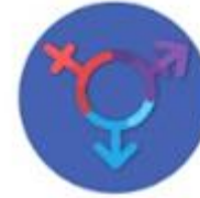
พฤติกรรม ทางเพศ