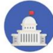
ความคิดเห็น ทางการเมือง