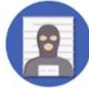
ประวัติ อาชญากรรม