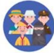
เชื้อชาติ เผ่าพันธุ์