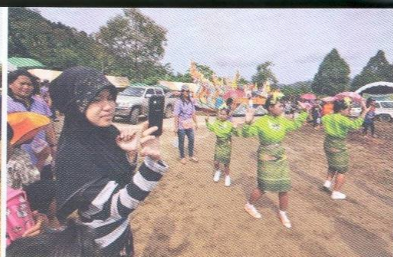
ชาวมุสลิมที่มาร่วมงานฯ แสดงถึงความสมานฉันท์บนความแตกต่างทางวัฒนธรรม และชาติพันธุ์ในท้องถิ่น

มีฐานะยากจนและไม่มีที่ดินทำกินจากท้องที่ต่างๆ เข้ามาประกอบอาชีพ เขตนิคมครอบคลุมพื้นที่ ๒ อำเภอ คือ อำเภอสุคิริน และอำเภอจะนะ พร้อมกับมีประกาศพระราชกฤษฎีกากำหนดแนวเขตจัดตั้งตามพระราชบัญญัติจัดที่ดินเพื่อการครองชีพ พ.ศ.๒๕๑๑ เมื่อวันที่ ๑๖ ธันวาคม ๒๕๑๗ วัตถุประสงค์ของการจัดตั้ง เพื่อบรรจุมุสลิมที่มีฐานะยากจนไม่มีที่ทำกินเป็นของตนเองเข้าทำประโยชน์ในที่ดินจัดสรร พัฒนาพื้นที่บริเวณชายแดนไทย-มาเลเซีย ที่มีสภาพรกร้างให้เกิดประโยชน์ทางเศรษฐกิจ และพัฒนาความมั่นคงทั้งทางด้านเศรษฐกิจสังคมและการเมืองในภูมิภาคชายแดนไทยตอนใต้สุด