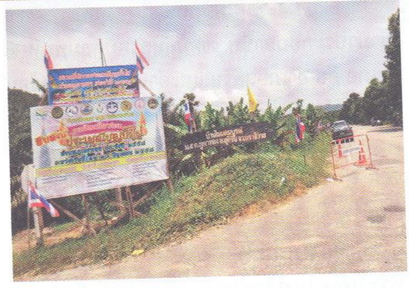
ป้ายประชาสัมพันธ์งานฯ

เดิมพื้นที่แถบนี้เป็นป่าดงดิบรกเรือ เต็มไปด้วยถ้ำอันตรายนานัปการ トラบกระทั่งเมื่อถึงยุค “ตื่นทอง” จึงเกิดความเปลี่ยนแปลงอย่างขนานใหญ่ เพราะมีชาวฝรั่งเศสได้เข้ามาขอสัมปทานทำเหมืองแร่ทองคำบริเวณเทือกเขาลีซอหรือเขาลีโซ ซึ่งตั้งอยู่ที่ตำบลโต๊ะโมะ กลายเป็นแม่เหล็กดึงดูดผู้คนให้อพยพเข้ามาอยู่เป็นจำนวนมาก ทางราชการจึงได้พิจารณาจัดตั้งพื้นที่แถบนี้เป็น “กิ่งอำเภอ” เพื่อให้