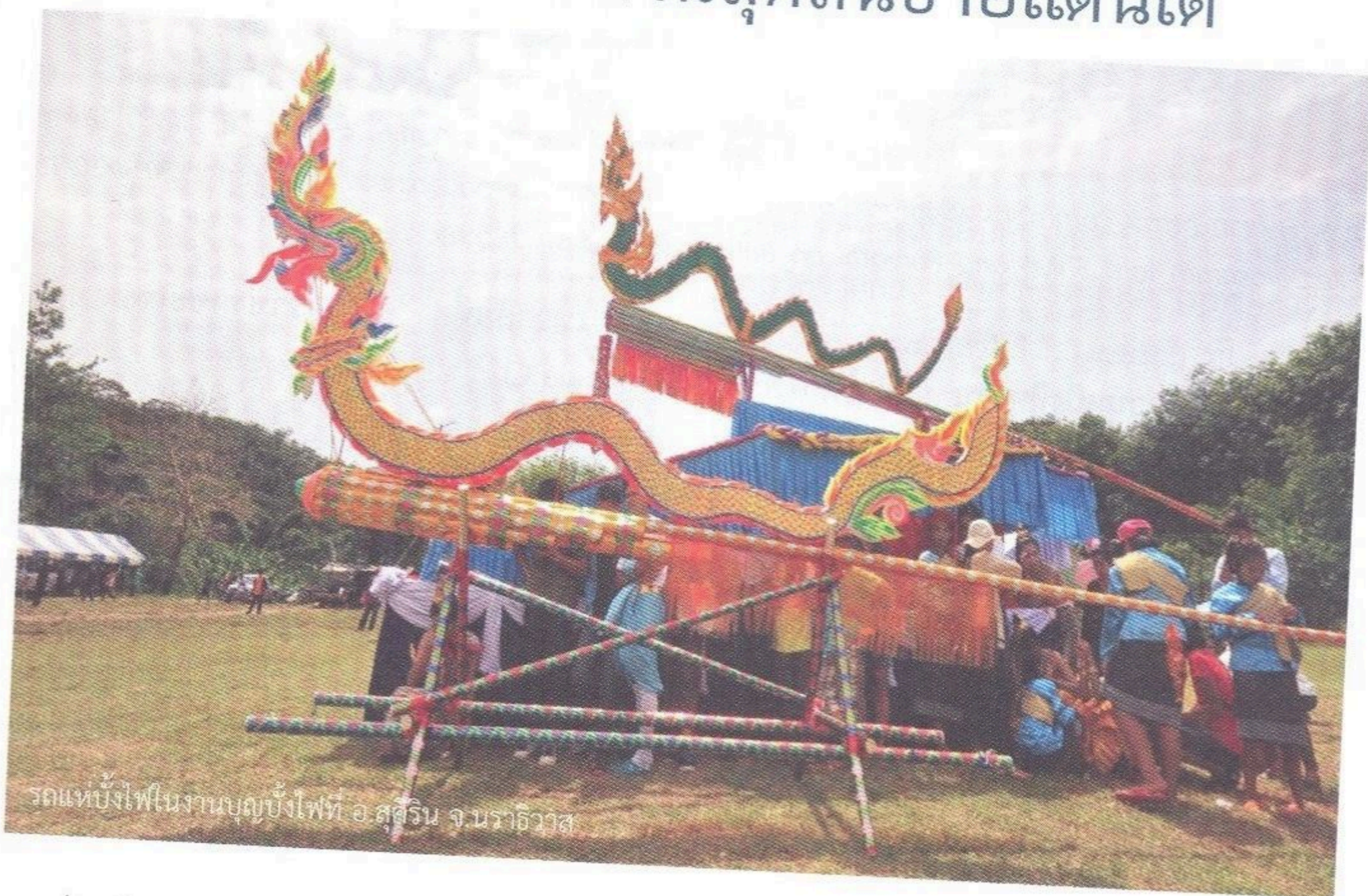
รถแห่บั้งไฟในงานบุญบั้งไฟที่ อ.สุคีริน จ.นราธิวาส

เราเดินทางออกจากตัวเมืองนราธิวาสประมาณ ๗ โมงเช้า อากาศกำลังดี บนท้องถนนรถราวิ่งกันไม่มากนัก พี่รูน - จรูญ ทองนวล ช่างภาพมือดีแห่งเครือเนชั่น ทำหน้าที่สารคดีขับรถแบบสบาย ๆ ไปตามเส้นทางสายนราธิวาส - ตากใบ ก่อนเข้าถึงตัวอำเภอตากใบเล็กน้อย รถเลี้ยวขวาเปลี่ยนเส้นทางบริเวณสามแยกมุ่งสู่เส้นทางตากใบ - สุโขทัย - ลก กระทั่งถึงอำเภอสุโขทัย-ลก แวะทานข้าวมันไก่ไหหลำ “ร้านโกฮุย” อันเลื่องชื่อคนละจานสองจาน ก่อนที่น้องอีก ๒ คนจากทีมงานประเด็นเด็ด ๗ สี จะเดินทางตามมาสมทบ แล้วพากันเดินทางต่อสู่เป้าหมาย