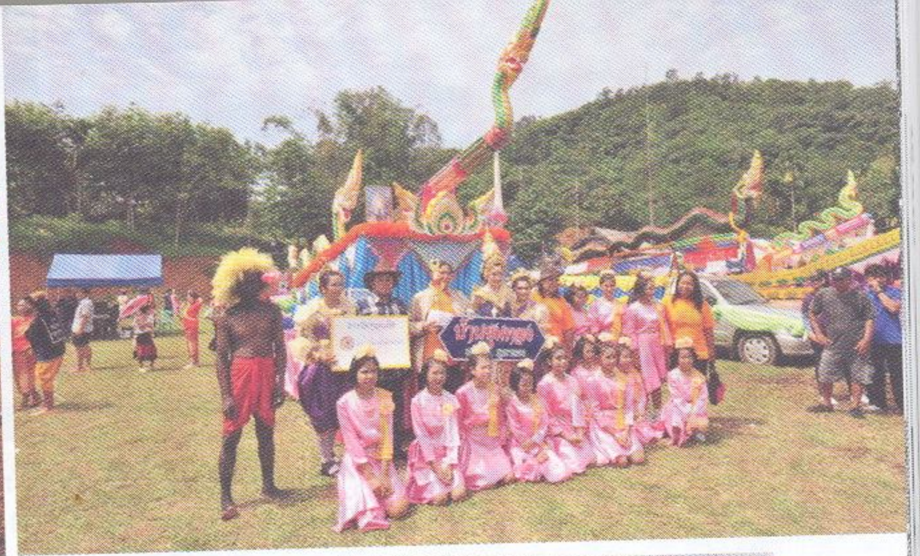
ขบวนแห่บั้งไฟที่สุสานตระการตาของชาวสุคริริน

เชือกหนึ่งคองามสง่ากำลังชักลากไม้อยู่ข้างทาง ใช้เวลางมหาพื้นที่จัดงานหลังหลงทางอีกเล็กน้อย ในที่สุดจึงเดินทางถึงบริเวณจัดงาน “บุญบั้งไฟ” ประจำปีพุทธศักราช ๒๕๕๘ ของชาวบ้านตำบลภูเขาทอง อำเภอสุคริริน จังหวัดนราธิวาส