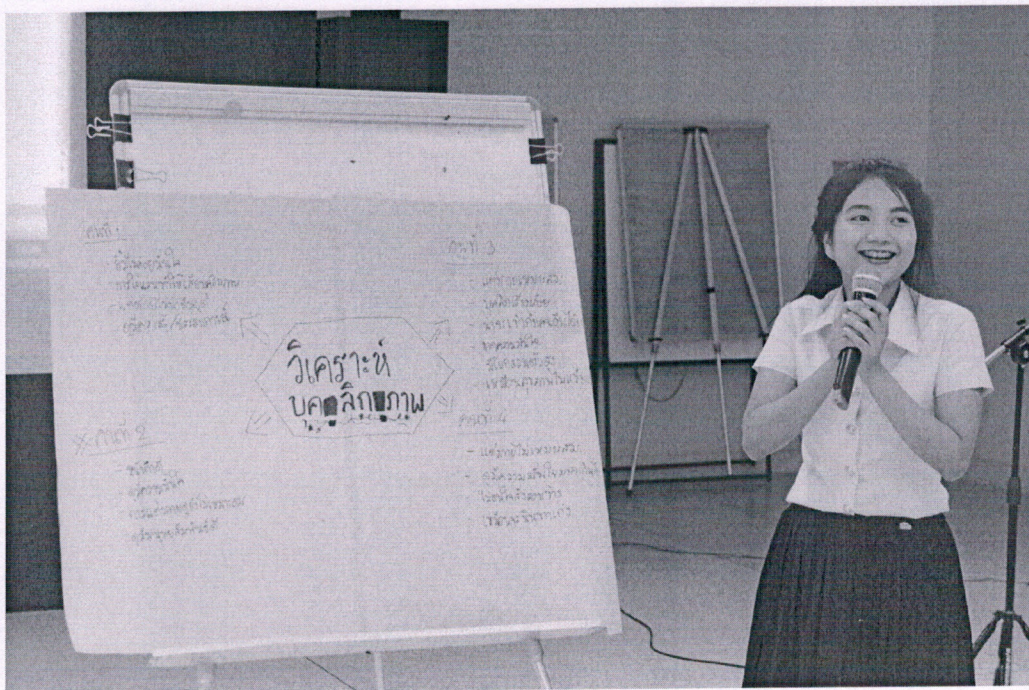
ผู้เข้าร่วมอบรมแสดงความคิดเห็นในกิจกรรมกลุ่ม