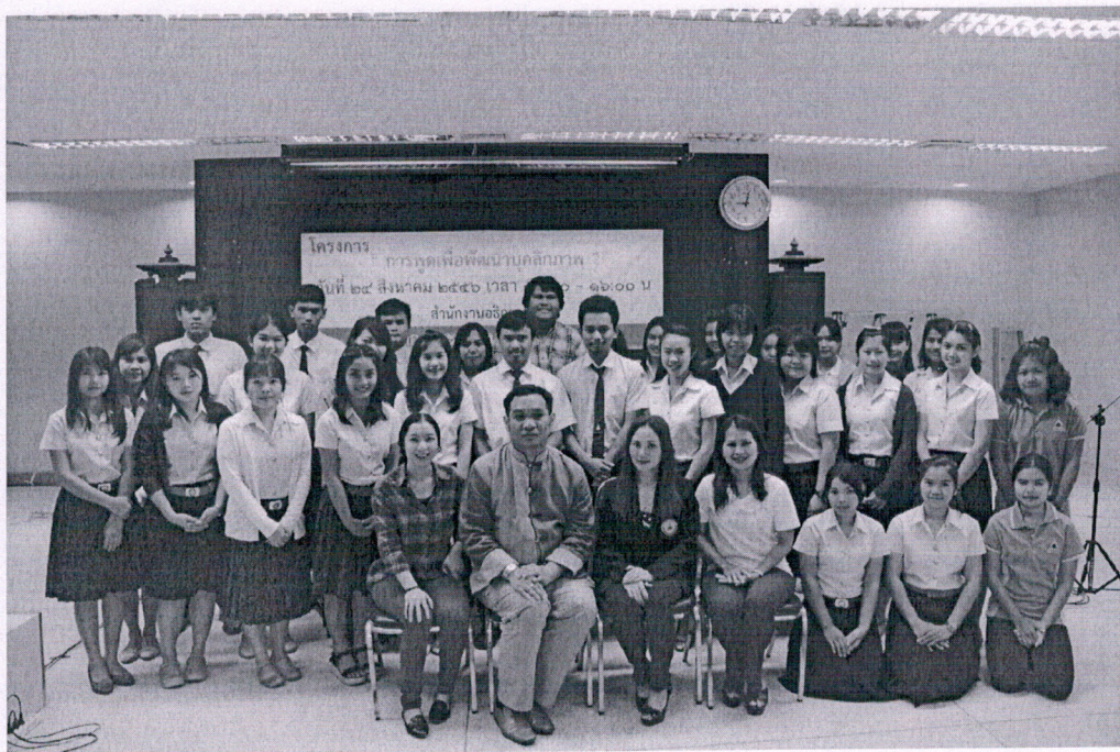
ผู้เข้าร่วมโครงการ การพูดเพื่อพัฒนาบุคลิกภาพ