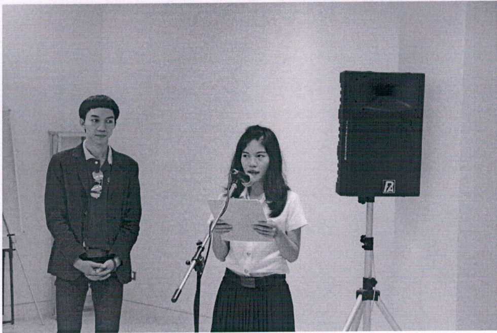
ประธานชมรมทอฝันวันใส กล่าวรายงานวัตถุประสงค์โครงการ