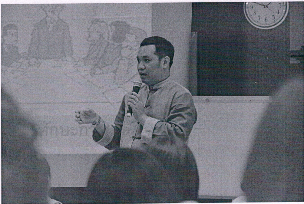
วิทยากรดำเนินกิจกรรมต่างๆ