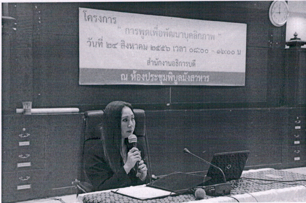
ประธานกล่าวเปิดงาน