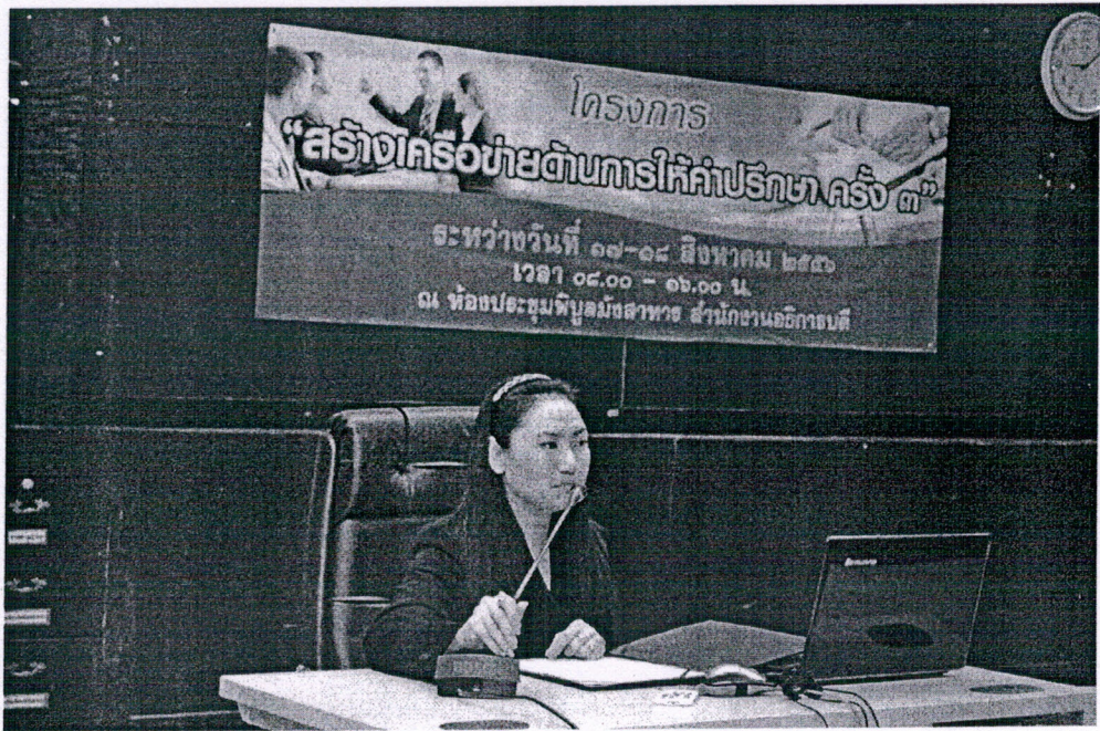
ประธานกล่าวเปิดงาน