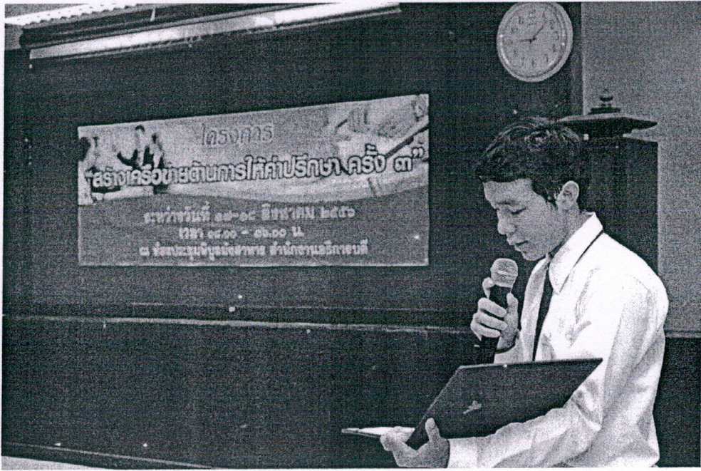
ประธานชมรมวิชาการ กล่าวรายงานวัตถุประสงค์โครงการ