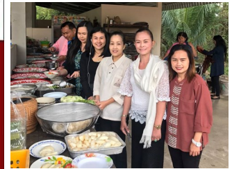
ส่วน กำนัญญูเลี้ยงนระเนลส่ง ท้ายปึกถ่ายต้อนรับปีใหม่ ณ วัด บ้านศรีโค หมู่ 4