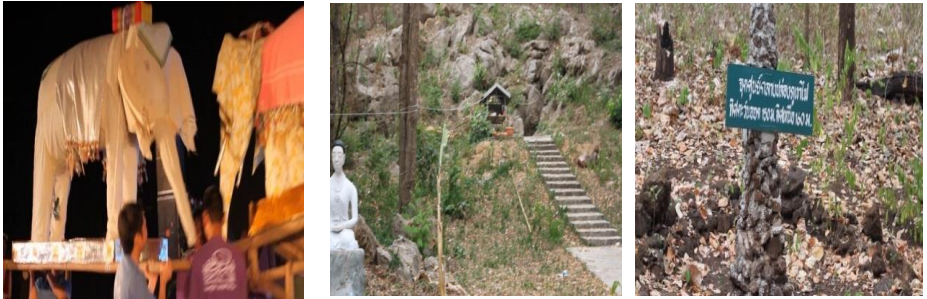
ภาพที่ 1 ตัวอย่างทรัพยากรท่องเที่ยวในชุมชน

การท่องเที่ยวในแหล่งท่องเที่ยวในเชิงธรรมชาติและวัฒนธรรมประเพณีภายใต้การดำเนินงานของคนในชุมชนอย่างแท้จริง