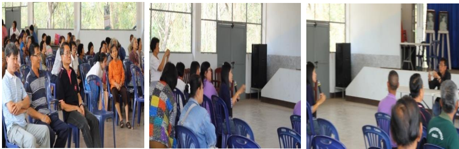
ภาพที่ 2 เวทีประชาคมหาแนวทางในการเตรียมความพร้อมรองรับนักท่องเที่ยวผู้สูงอายุ

สำหรับแนวทางในการพัฒนาและเตรียมความพร้อมในการรองรับนักท่องเที่ยวกลุ่มผู้สูงอายุของการท่องเที่ยวชุมชนบ้านแม่หลวงภายใต้แนวคิดของประชาชนในชุมชน โดยสรุปได้ดังนี้