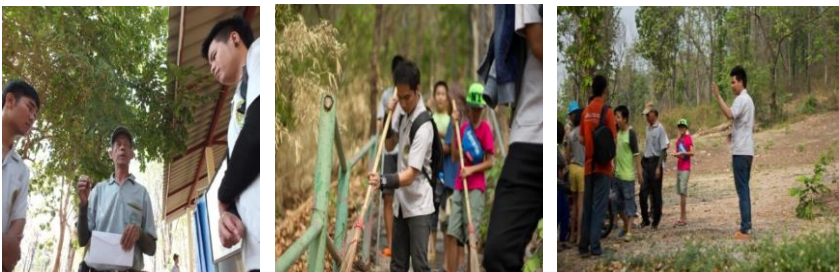
ภาพที่ 3 การดำเนินกิจกรรมพัฒนาสถานที่ท่องเที่ยวให้สามารถรองรับนักท่องเที่ยวสูงอายุ

ซึ่งภายหลังการดำเนินกิจกรรม ชุมชนมีการถอดบทเรียนเพื่อสรุป และทบทวนผลการดำเนินงาน พบว่า กลุ่มตัวอย่างที่เข้าร่วมกิจกรรม โดยเฉพาะกลุ่มเยาวชนในชุมชน มีความพึงพอใจต่อกิจกรรมดังกล่าวและมีความต้องการให้เกิดกิจกรรมแบบนี้อย่างต่อเนื่องเพื่อส่งเสริมการท่องเที่ยวของชุมชนให้มีประสิทธิภาพและสามารถดึงดูดนักท่องเที่ยวผู้สูงอายุ รวมถึงนักท่องเที่ยวกลุ่มต่างๆ ได้สามารถเข้ามาแลกเปลี่ยนเรียนรู้ความแตกต่างทางทรัพยากรธรรมชาติ รวมถึงทรัพยากรทางวัฒนธรรมที่เป็นเอกลักษณ์ของชุมชน