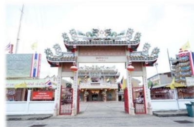
5.มูลนิธิการกุศลอุบลราชธานี ส่วนสังฆมณฑลระพี จันทิมา

ที่อยู่ 42 ถนนราชวงศ์ ตำบลในเมือง อำเภอเมืองอุบลราชธานี จังหวัดอุบลราชธานี 34000