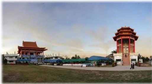
สถานธรรมไฟเต๋อ อุบลราชธานี

5. โครงการ “ฐานข้อมูลชาวไทยเชื้อสายจีนในจังหวัดอุบลราชธานี: ประติมากรรมรูปเคารพในศาสนสถานจีน” เพื่อรวบรวมจัดทำฐานข้อมูลองค์ความรู้เกี่ยวกับเทวรูปเคารพจีนในศาสนสถานจีนในจังหวัดอุบลราชธานี และเพื่อฝึกประสบการณ์ให้นักศึกษาในการลงพื้นที่ภาคสนามเพื่อเก็บข้อมูลทางวัฒนธรรม สร้างความรู้ ทักษะ ประสบการณ์และการตระหนักรู้เกี่ยวกับการอนุรักษ์ศิลปวัฒนธรรมในท้องถิ่น