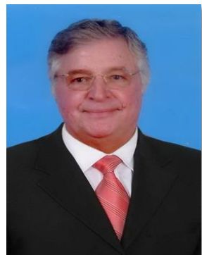
ศาสตราจารย์เอลิวโอ โบโนลโล