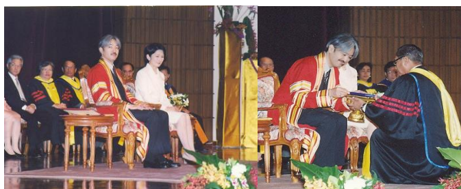
เจ้าชายอากิชิโน แห่งประเทศญี่ปุ่น วิทยาศาสตร์ดุษฎีบัณฑิตกิตติมศักดิ์ สาขาวิชาเกษตรศาสตร์ (สภามหาวิทยาลัยอนุมัติ ๘ มิถุนายน ๒๕๔๕)