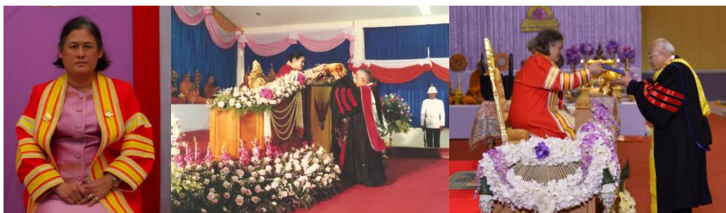
สมเด็จพระเทพรัตนราชสุดาฯ สยามบรมราชกุมารี วิทยาศาสตร์ดุษฎีบัณฑิตกิตติมศักดิ์ สาขาวิชาวิทยาศาสตร์สิ่งแวดล้อม (สภามหาวิทยาลัยอนุมัติ ๙ กันยายน ๒๕๓๘) เกษศาสตร์ดุษฎีบัณฑิตกิตติมศักดิ์ สาขาวิชาเกษตรศาสตร์ (สภามหาวิทยาลัยอนุมัติ ๒ กันยายน ๒๕๔๓) ปรัชญาดุษฎีบัณฑิตกิตติมศักดิ์ สาขาวิชาประวัติศาสตร์ (สภามหาวิทยาลัยอนุมัติ ๒ สิงหาคม ๒๕๕๗)