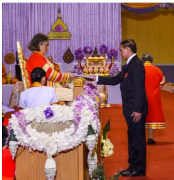
บริษัทซีพีเอฟ (ประเทศไทย) จำกัด