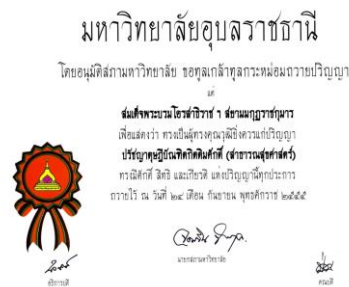
สมเด็จพระบรมโอรสาธิราชฯ สยามมกุฎราชกุมาร ปรัชญาดุษฎีบัณฑิตกิตติมศักดิ์ สาขาวิชาการสาธารณสุขศาสตร์ (สภามหาวิทยาลัยอนุมัติ ๒๒ กันยายน ๒๕๕๕)