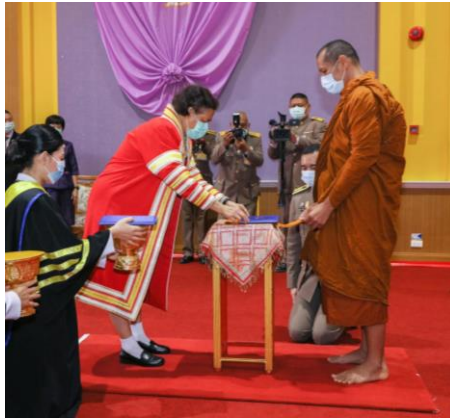
พระครูวิมลปัญญาคุณ