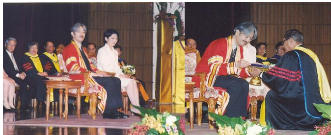
เจ้าชายอากิชิโน แห่งประเทศญี่ปุ่น วิทยาศาสตร์ดุขฎิบัณฑิตกิตติมศักดิ์ สาขาวิชาเกษตรศาสตร์ (สภามหาวิทยาลัยอนุมติ ๘ มิถุนายน ๒๕๔๕)