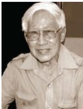
ศาสตราจารย์พทยา สายหู