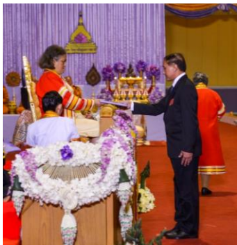
บริษัทซีพีเอฟ (ประเทศไทย) จำกัด