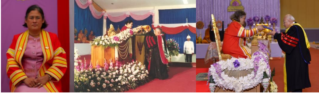
สมเด็จพระเทพรัตนราชสุดาฯ สยามบรมราชกุมารี วิทยาศาสตร์ดุขฎิบัณฑิตกิตติมศักดิ์ สาขาวิชาวิทยาศาสตร์สิ่งแวดล้อม (สภามหาวิทยาลัยอนุมติ ๙ กันยายน ๒๕๓๘) เกษศาสตรดุขฎิบัณฑิตกิตติมศักดิ์ สาขาวิชาเกษตรศาสตร์ (สภามหาวิทยาลัยอนุมติ ๒ กันยายน ๒๕๔๓) ปรัชญาดุขฎิบัณฑิตกิตติมศักดิ์ สาขาวิชาประวัติศาสตร์ (สภามหาวิทยาลัยอนุมติ ๒ สิงหาคม ๒๕๕๗)