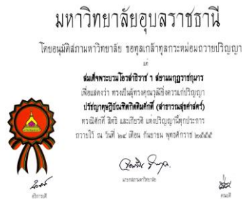
สมเด็จพระบรมโอรสาธิราชฯ สยามมกุฎราชกุมาร ปรัชญาดุขฎิบัณฑิตกิตติมศักดิ์ สาขาวิชาการสาธารณสุขศาสตร์ (สภามหาวิทยาลัยอนุมติ ๒๒ กันยายน ๒๕๕๕)