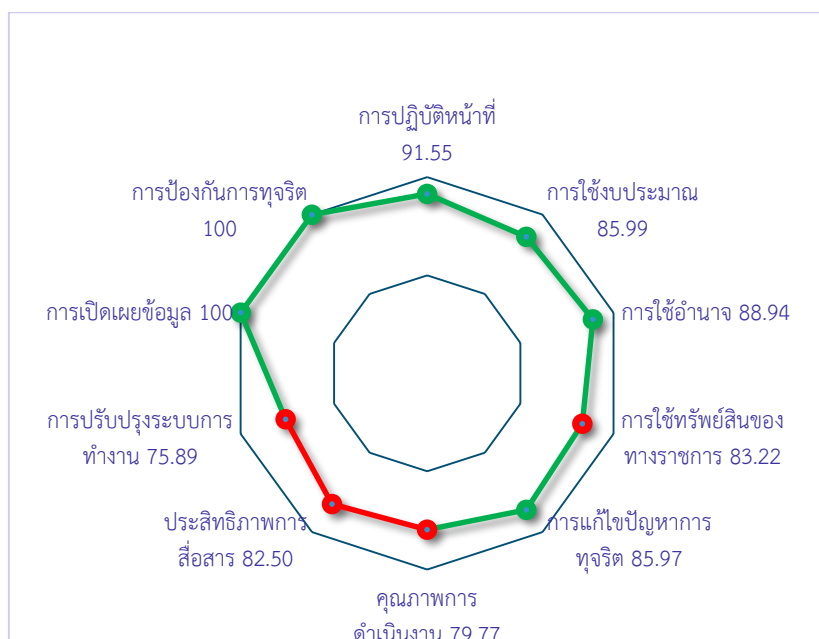
รูปภาพที่ 2 รายงานผลการประเมินคุณธรรมและความโปร่งใสในการดำเนินงานของหน่วยงานภาครัฐ ประจำปีงบประมาณ พ.ศ. 2564 มหาวิทยาลัยอุบลราชธานี