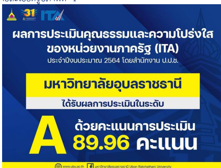
รูปภาพที่ 1 ผลการประเมินคุณธรรมและความโปร่งใสในการดำเนินงานของหน่วยงานภาครัฐ มหาวิทยาลัยอุบลราชธานี ประจำปีงบประมาณ พ.ศ. 2564

โดยมหาวิทยาลัยอุบลราชธานี ได้คะแนนเท่ากับร้อยละ ซึ่งถือว่ามีคุณธรรม 96.89มและความโปร่งใสในการดำเนินงานระดับ A และอยู่ในลำดับที่ หน่วยงานประเภท 83 จากจำนวนทั้งหมด 42 สถาบันอุดมศึกษา รายละเอียดรูปภาพที่ 1