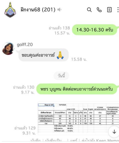
รูปที่ 4.3 การสื่อสารผ่าน LINE กับนักศึกษา

ผลการดำเนินงานการใช้ระบบการขออนุมัติการฝึกประสบการณ์ของนักศึกษาสาขาวิชาการจัดการธุรกิจ คณะบริหารศาสตร์ ภาควิชาการศึกษาปลาย ปีการศึกษา 2567 พบว่าลตรยะเวลาการดำเนินการด้านการขออนุมัติสถานประกอบการได้จริง ดังนี้