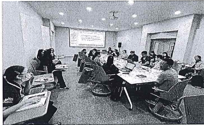
การประชุมและการจัดการสินทรัพย์ในวันที่ 26 – 29 มีนาคม 2567

จากข้อเท็จจริงดังกล่าว ผู้พัฒนา ได้ลบข้อมูลทะเบียนสินทรัพย์เดิมที่คลาดเคลื่อนจากระบบ UBUFMIS ปี 2566 ลงไปออกจะฐานข้อมูล และนำข้อมูลทะเบียนสินทรัพย์ของส่วนราชการที่ผู้รับผิดชอบยืนยันข้อมูลถูกต้อง เข้าระบบ UBUFMIS แล้วเสร็จ เมื่อวันที่ 31 มีนาคม 2567