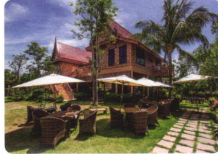
Room Categories (Total 23 rooms)

ให้บริการเครื่องดื่ม และอาหารทั้งไทยและนานาชาติ เมนูพลาดไม่ได้อาหารทะเลสดจากฟาร์มของรีสอร์ท ปูรงหลากหลายเมนู ผักออร์แกนิก ผลไม้และผักสวนครัวปลอดสารพิษของรีสอร์ท ที่นำมาปรุงอาหาร ทำให้ทุกท่านได้พักผ่อนและทานอาหารที่ดีต่อสุขภาพ ตามคอนเซ็ปต์ stay green eat clean