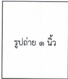
รูปถ่าย ๑ นิ้ว