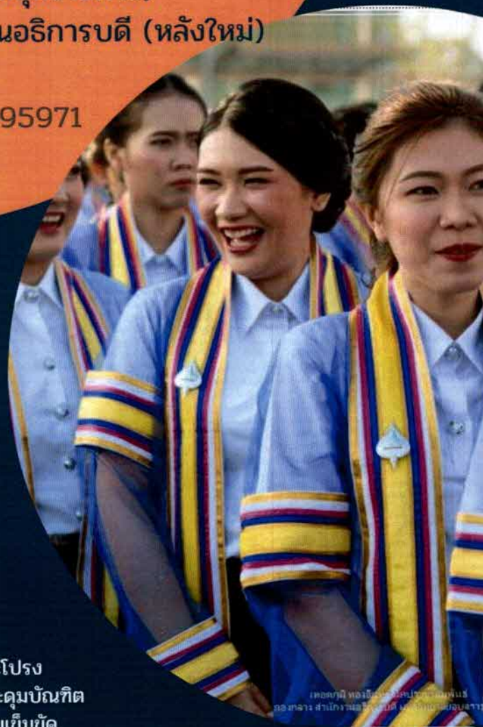
เพ็ญภาณี ห้องเรียนศิลปวัฒนธรรม กองกลาง สำนักงานอธิการบดี มหาวิทยาลัยอุบลราชธานี