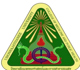
ภาพที่ 1 สัญลักษณ์ประจำวิทยาลัยแพทยศาสตร์และการสาธารณสุข

ต่อมาในปี พ.ศ. 2548 มหาวิทยาลัยอุบลราชธานี ได้มีมติมอบหมายให้ วิทยาลัยแพทยศาสตร์และการสาธารณสุข ดำเนินการเพิ่มเติมนอกเหนือจากการผลิตบัณฑิตแพทย์ โดยให้มีการดำเนินการในการรับนักเรียนและจัดการเรียนการสอนเพิ่มขึ้นอีกหนึ่งหลักสูตรคือ หลักสูตรวิทยาศาสตรบัณฑิต สาขาวิชาสาธารณสุขศาสตร์ เพื่อช่วยแก้ไขปัญหาการขาดแคลนบุคลากรทางด้านนักรักษาการสาธารณสุขในพื้นที่ 4 จังหวัดอีสานใต้ทางด้านตะวันออก