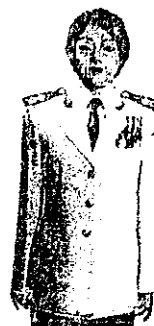
เครื่องแบบเต็มยศและครึ่งยศ

ห้อยกับแพรแถบแบบบุรุษ ประดับที่อกเสื้อเบื้องซ้าย ร่วมกับเหรียญราชอิสริยาภรณ์ และเหรียญที่พระราชทาน เป็นที่ระลึกในโอกาสต่าง ๆ