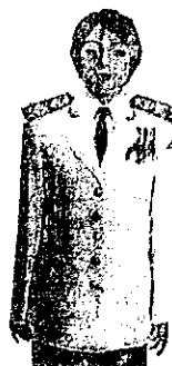
เครื่องแบบเต็มยศและครึ่งยศ

ประดับแพรแถบ เหรียญที่พระราชทานเป็นพระลัญจก ในโอกาสต่าง ๆ แบบประ ทอกเสื้อเบื้องซ้าย