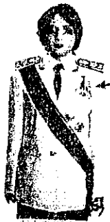
เครื่องแบบเต็มยศ

ประดับดารา ดวงตรา และสวมสายสะพายเช่นเดิม