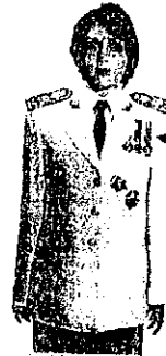
เครื่องแบบครึ่งยศ

เหรียญราชอิสริยาภรณ์ เช่น เหรียญจักรพรรดิมาลา เหรียญที่พระราชทานเป็นที่ระลึก ในโอกาสต่าง ๆ ให้ประดับโดยใช้แพรแถบ แบบบุรุษ