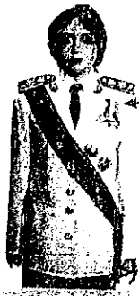
เครื่องแบบเต็มยศ

ประดับดารา ดวงตรา และสามสายสะพายเช่นเดิม